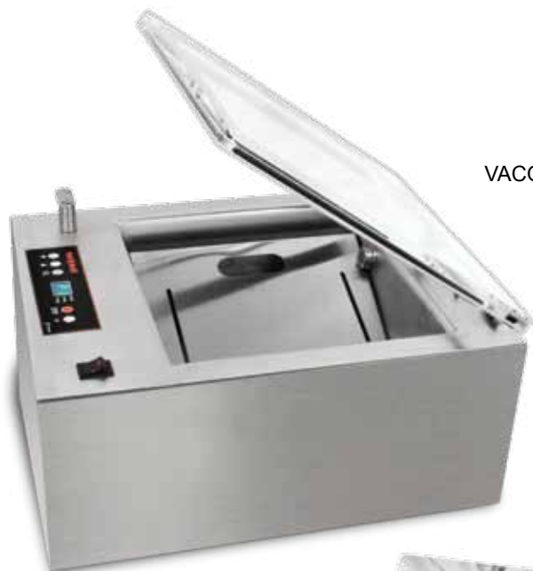
VACOMAT 2 TT