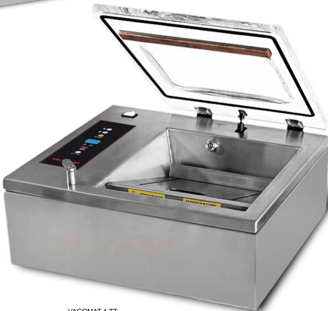
VACOMAT 1 TT